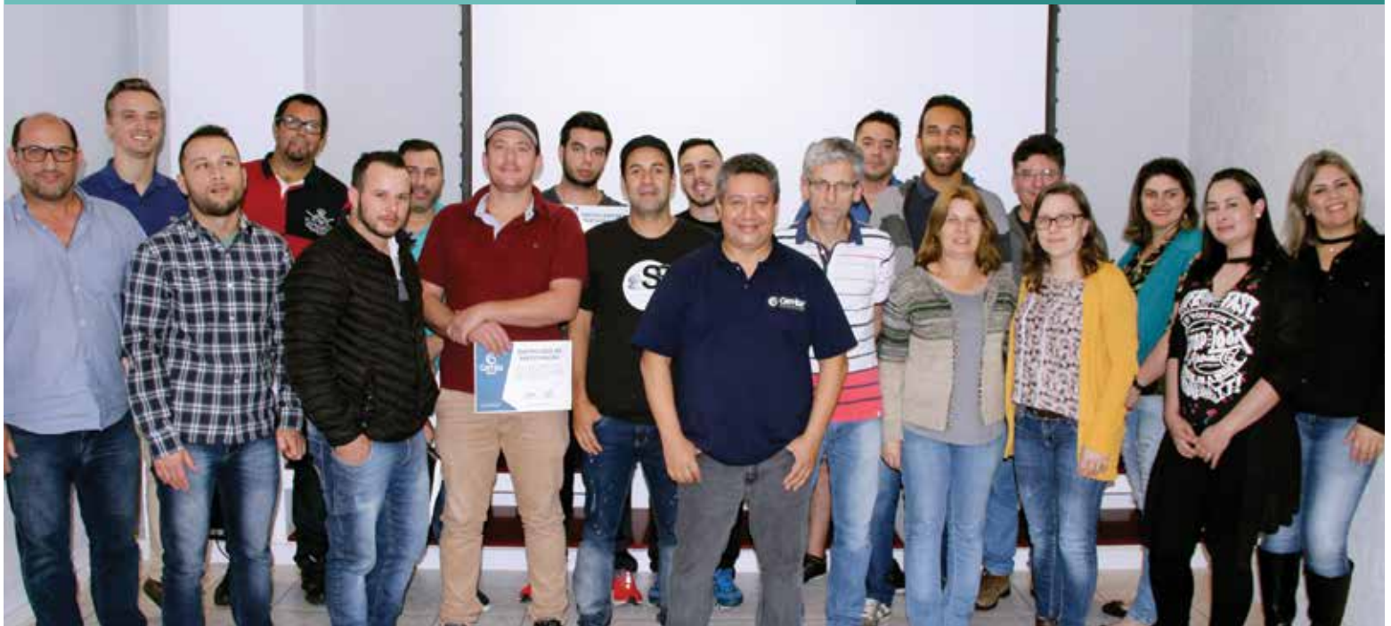
Seletroar promoveu a qualificação de centenas de trabalhadores em 2018