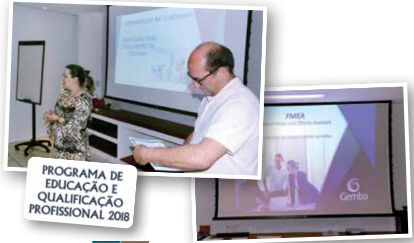
PROGRAMA DE EDUCAÇÃO E QUALIFICAÇÃO PROFISSIONAL 2018

A educação e qualificação profissional significa a possibilidade de acesso a melhores oportunidades de trabalho, ao crescimento e ascensão na carreira e à realização pessoal. Por essas razões, o Programa de Educação e Qualificação Profissional é uma de nossas prioridades. Até o final de 2018 diversos cursos estarão sendo realizados na sede do sindicato para todos os trabalhadores da categoria. Para 2019, o planejamento é de expansão dos cursos, com a inclusão de EaD (Ensino à Distância), a continuidade dos treinamentos presenciais e a realização de palestras e seminários.